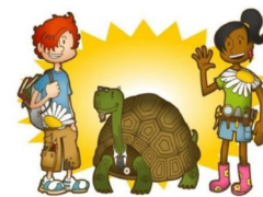
RAZISKOVALCI BIOTSKE RAZNOVRSTNOSTI

Več o razpisanih vsebinah in gradivih na povezavi .